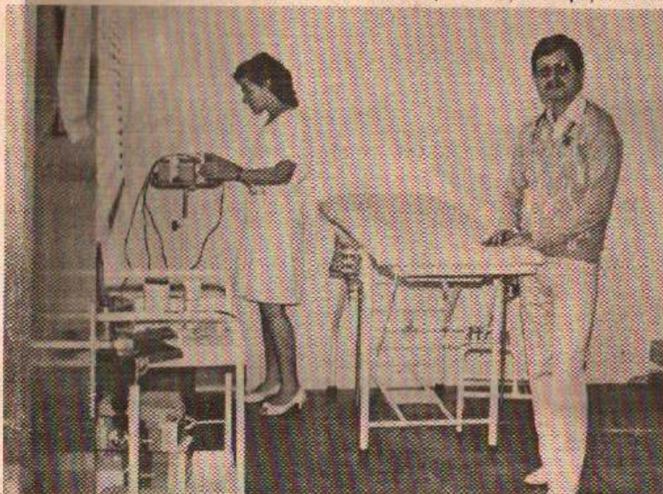
Com este trabalho, a Popi completa um amplo serviço de assistência social a seus funcionários.